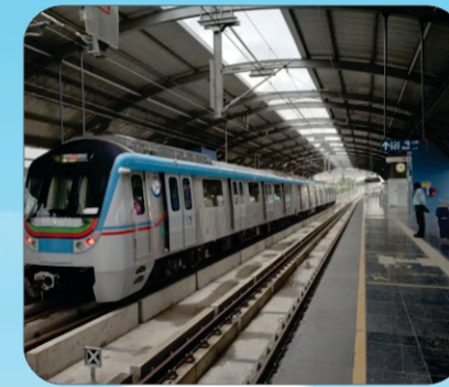
Metro Railway Line