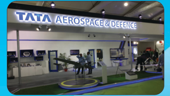
TATA AEROSPACE & DEFENCE