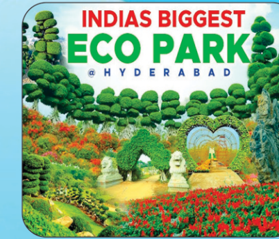
ECO Tourism Park