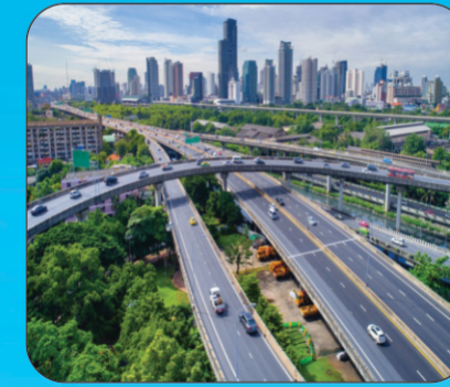
Outer Ring Road (ORR)